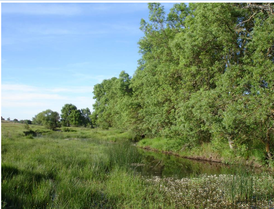
F.69.1.- Fresneda en los márgenes del río Oblea.