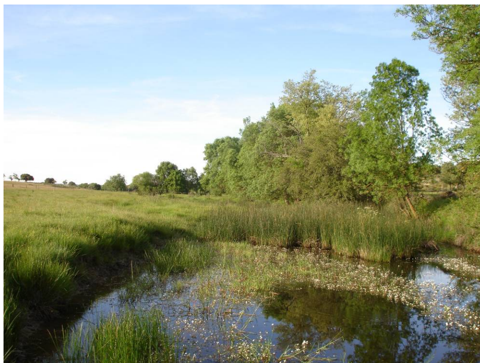
F.69.3.- Ribera de frenos y melojos cerca de Castillejo de Evans.