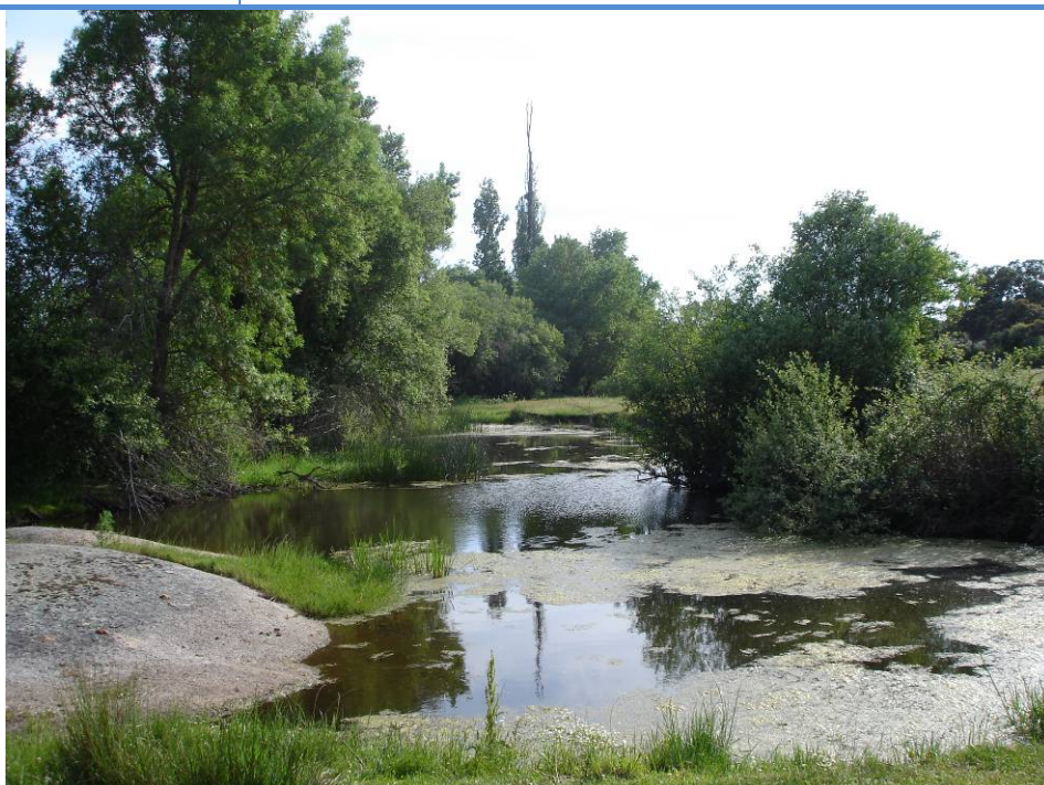
F.69.6.- Río Oblea cerca de su desembocadura.