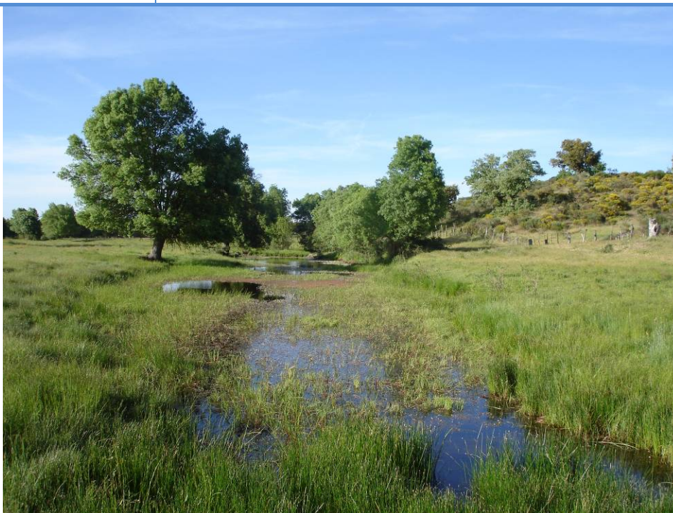
F.69.4.- Oblea a su paso por Castillejo de Evans.