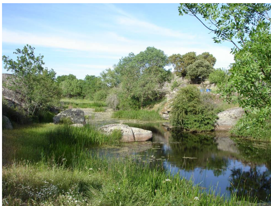
F.69.5.- Tramo del Oblea de Pelarrodríguez.